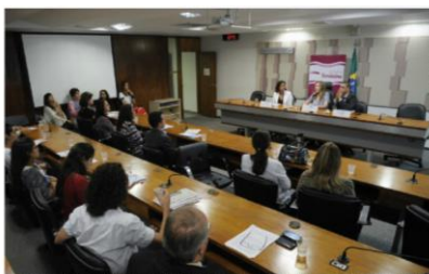
Entidades, familiares e profissionais da educação lotaram o auditório da CMA

A 1ª edição do projeto em 2016 aconteceu no dia 25 de fevereiro no auditório da Comissão do Meio Ambiente (CMA) do Senado.